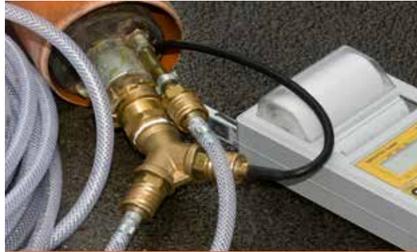
Gerät zur Dichtheitsprüfung mit Luftdruck