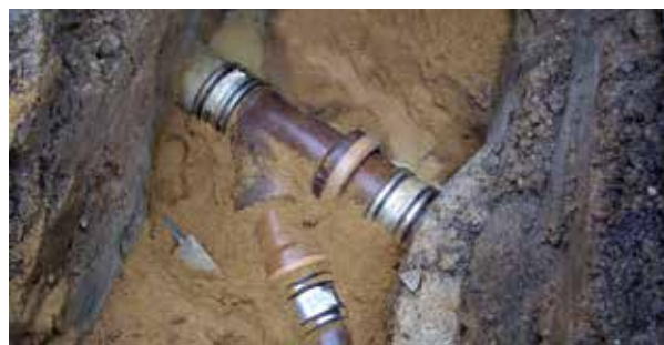
Reparatur einer Leitung in offener Baugrube

Bei größeren Tiefen und vor allem bei aufwändig gestalteter oder überbauter Oberfläche steigen die Kosten für offene Baugruben stark an. Vor allem bei Leitungen unter der Bodenplatte sollten Alternativen, insbesondere die zugängliche Installation (siehe 4.4.5) geprüft werden.