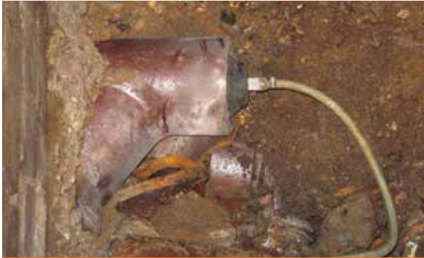
Absperrblase zur Dichtheitsprüfung