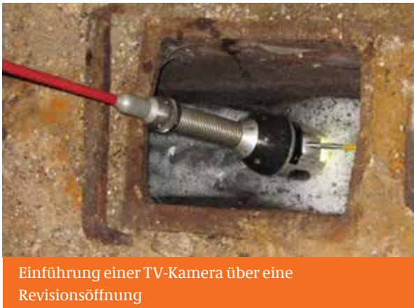
Einführung einer TV-Kamera über eine Revisionsöffnung

Die Ergebnisse der Inspektion sind durch die Prüffirma entsprechend dem geltenden Regelwerk in textlicher Beschreibung und auf Video festzuhalten.