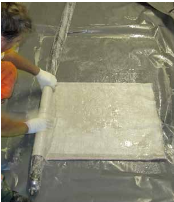
Vorbereitung eines Kurzliners

Voraussetzung für das Liningverfahren ist, dass die ursprüngliche Querschnittsform des Altrohres noch erhalten ist (keine Deformationen oder Einbrüche). Die Erreichung der erforderlichen Materialeigenschaften und der Wasserdichtheit kann anhand von Proben nachgewiesen werden. An Kleinstproben kann man die ordnungsgemäße Aushärtung kontrollieren.