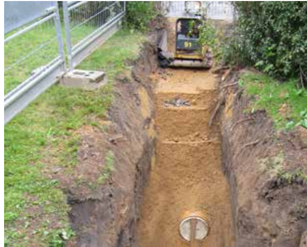
Erneuerung im offenen Graben

Auch bei Abwasserleitungen im Straßebereich sollte wegen des Aufwandes auf Alternativen, wie z. B. das Liningverfahren zurückgegriffen werden.