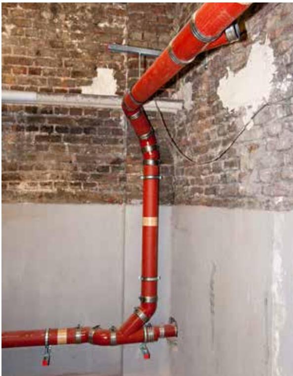
Abgehängte Leitungen an der Kellerwand

Sofern ein Keller vorhanden ist, besteht vielfach die Möglichkeit, die im Kellerbereich vorhandenen Ablaufstellen wie Waschbecken oder Bodeneinläufe aufzugeben und die vom Erdgeschoss kommenden Fallleitungen an der Kellerdecke abzufangen und hoch liegend nach außen zu führen. Das Abwasser einzelner Ablaufstellen im Kellerbereich kann mit einer Pumpe in diese Leitungen gehoben werden.