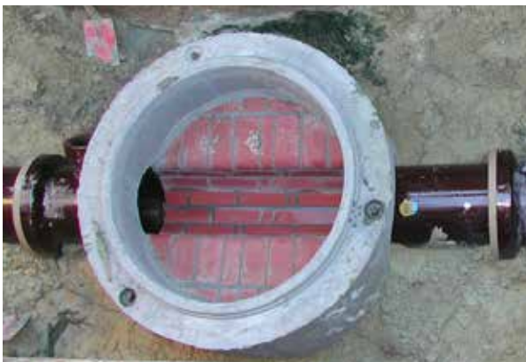
Einbau eines Revisionsschachtes

Keinesfalls sollten Sie sich von einer Firma zu einer sofortigen Dichtheitsprüfung oder Sanierung überreden lassen. Vermeiden Sie Geschäfte an der Haustür! Planen Sie in Ruhe die erforderlichen Arbeiten, holen Sie sich unabhängigen Rat ein und fragen mehrere Firmen an, um vergleichen zu können. Die Dichtheitsprüfung und die Sanierung sollten grundsätzlich von verschiedenen Firmen durchgeführt werden. Einige Städte und Gemeinden geben dabei Hilfestellung und stellen auch Vertragsmuster zur Verfügung. Soweit Sie selbst nicht fachkundig sind, sollten Sie für die Planung und Überwachung der Arbeiten ein unabhängiges Ingenieurbüro für Grundstücksentwässerung hinzuziehen.