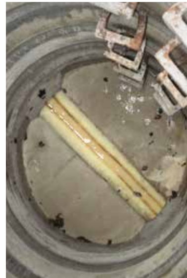
Linerdurchführung im Schacht