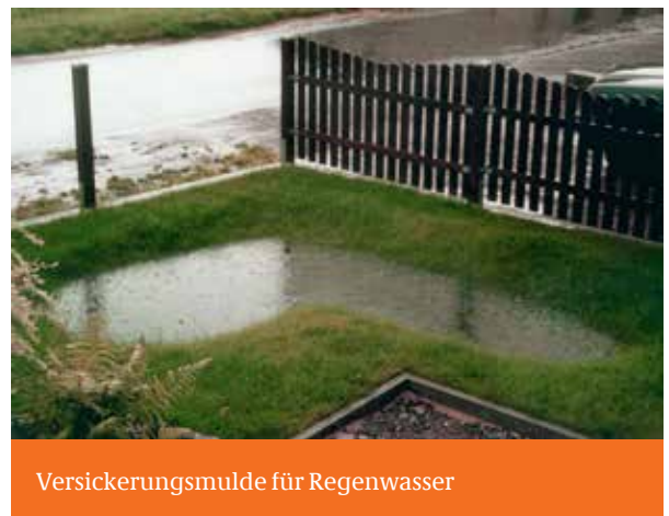
Versickerungsmulde für Regenwasser

Zu beachten ist, dass auch undichte Leitungen eine dränierende Wirkung haben können. Deshalb kann es nach einer Leitungsabdichtung durch dann steigende Grundwasserspiegel zu Gebäudevernässungen kommen. Das mögliche Risiko sollte durch einen Fachmann beurteilt werden.