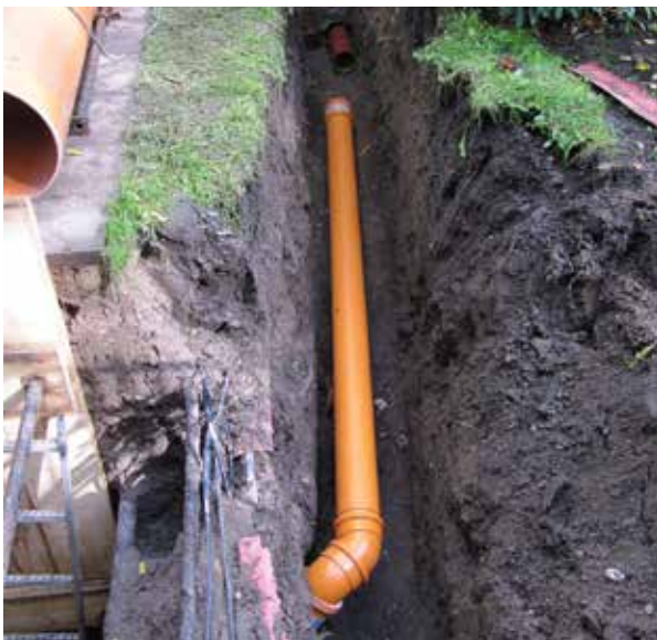
Erneuerung einer Abwasserleitung

Zur Einschätzung möglicher Gefährdungen sollten Sie einen Fachmann zu Rate ziehen. Gegebenenfalls werden Sie auch von Ihrer Stadt bzw. Gemeinde zur Sanierung innerhalb einer bestimmten Frist aufgefordert.