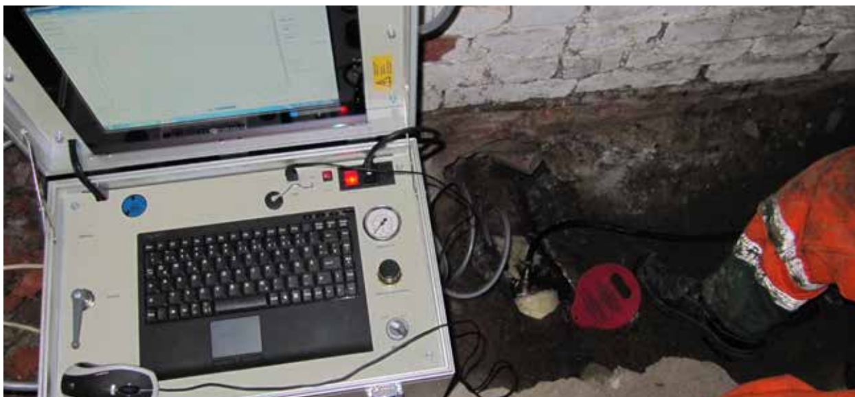
Druckverlustmessung bei der Dichtheitsprüfung mit Luftdruck