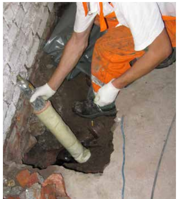
Einführung des Kurzliners in die defekte Leitung