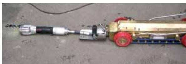
Beispiel einer TV- Kamera

Bei gewerblichem Schmutzwasser, in Wasserschutzgebieten sowie in Gebieten, wo Grund- und Sickerwasser aus dem Boden in undichte Leitungen dringt (Fremdwasser), kann auch bei bestehenden Leitungen eine Prüfung mit Wasser- oder Luftdruck erforderlich sein. Darüber hinaus muss eine Prüfung mit Wasser oder Luft durchgeführt werden, wenn eine TV-Inspektion nicht möglich ist.