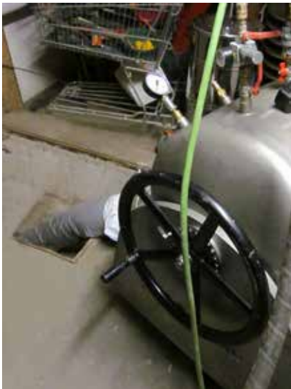
Einbautrommel für das Liningverfahren