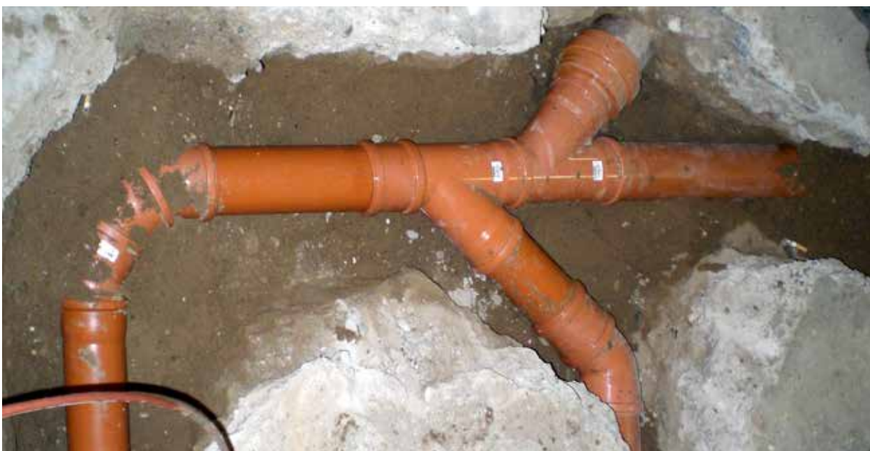
Aufwändige Erneuerung von Abwasserleitungen unter der Bodenplatte

Leitungsgräben müssen in Abhängigkeit der Tiefe und des anstehenden Bodens durch einen Verbau gesichert werden. Im Gebäudebereich ist außerdem darauf zu achten, dass die Standsicherheit des Gebäudes bei Aushubarbeiten nicht gefährdet wird.