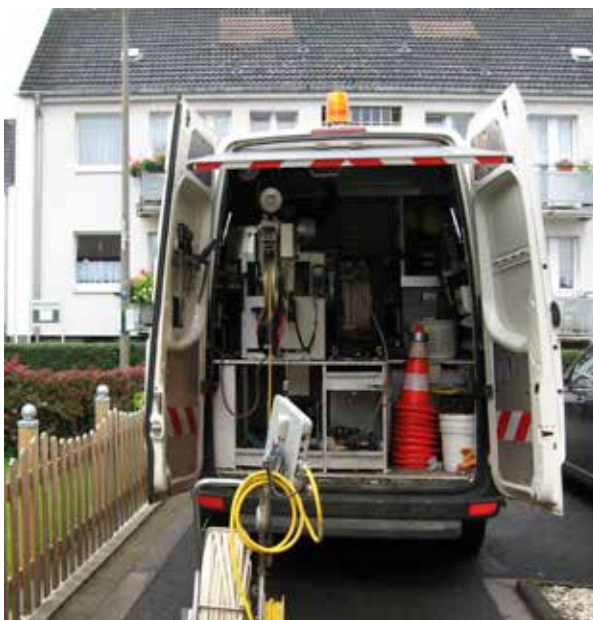
TV-Inspektionsfahrzeug im Einsatz

Nur die Leitungen, die im Erdreich (auch unterhalb des Gebäudes) oder unzugänglich verlegt sind, müssen regelmäßig überprüft werden. Leitungen innerhalb des Gebäudes unterliegen dieser Prüfpflicht nicht, weil hier austretendes Abwasser direkt bemerkt wird. Das gleiche gilt für Leitungen in Schutzrohren, wenn ein Abwasseraustritt festgestellt werden kann.